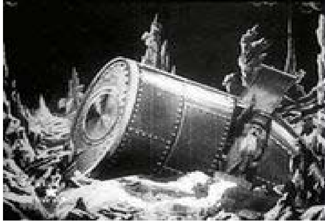
Los primeros pasos del hombre en la Luna de acuerdo a la película del cineasta galo.

No desmerezco para nada el poder visionario de Verne, del que hay pruebas concretas. Pero ante la duda de si el hombre pisó verdaderamente la Luna, prefiero como Méliès quedarme en las aguas tranquilas de la ilusión y agradecerle a Verne haberme llevado en sus Viajes Extraordinarios con la imaginación ●