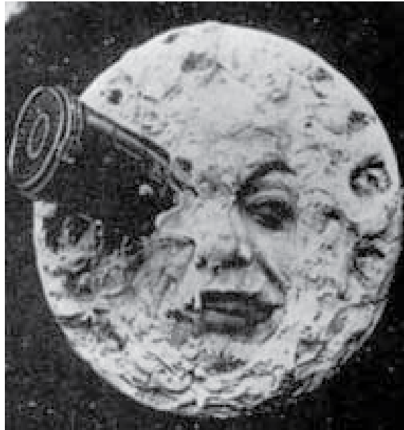
Legendaria imagen del filme del cineasta francés que ha recorrido el mundo como un símbolo de muestra de una de las primeras películas realizadas

Exhibido en 1902, es el primer filme de Ciencia Ficción. Es interesante que se haya hecho mientras Verne y H. G. Wells, los llamados padres del género y cuyos relatos lo inspiraron, aún vivían. El