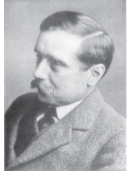
Herbert George Wells hacia 1922.

concepto, por ejemplo, de cuarta dimensión, tomó forma matemática alrededor de la década del cuarenta del siglo XIX. Herbert tomó esta idea y su poder imaginativo le sirvió para escribir, en 1895, una de las más