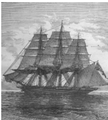
El Chancello, barco inglés de tres palos a vela