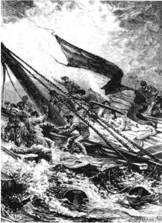
La tormenta se encuentra en todo su apogeo. El viento ha pasado al estado de huracán y las olas, que son terribles, amenazan con destrozarse la balsa