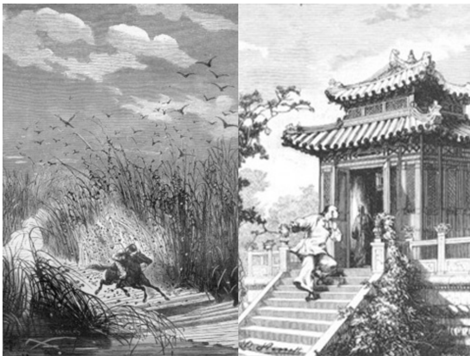
En la obra de Verne abundan las novelas de aventura en su estado más puro y dos ejemplos de este hecho lo constituyen “Miguel Strogoff” y “Las tribulaciones de un chino en China”.

bien ser considerado el iniciador cronológico del género, pero es muy atinado fundamentar que es Herbert George Wells quien determinará más decididamente el futuro del mismo a través de una mayor riqueza de temas. Los dos escritores estaban impregnados por el pensamiento científico de la época, eran novelistas y supieron obtener un difícil equilibrio entre la ilusión fabuladora y la verosimilitud científica. Ambos escribieron relatos de aventuras “extraordinarias” donde intentan que sus lectores se interroguen sobre las aportaciones y las futuras conquistas de la Ciencia y la tecnología. Quizá la diferencia más importante sea que las especulaciones de Verne tienen una vertiente esencialmente científico-tecnológica, mientras que las de Wells incorporan también elementos de las Ciencias Sociales y de la Filosofía. Si bien Verne es un precursor, Wells es el verdadero fundador y padre del género ●