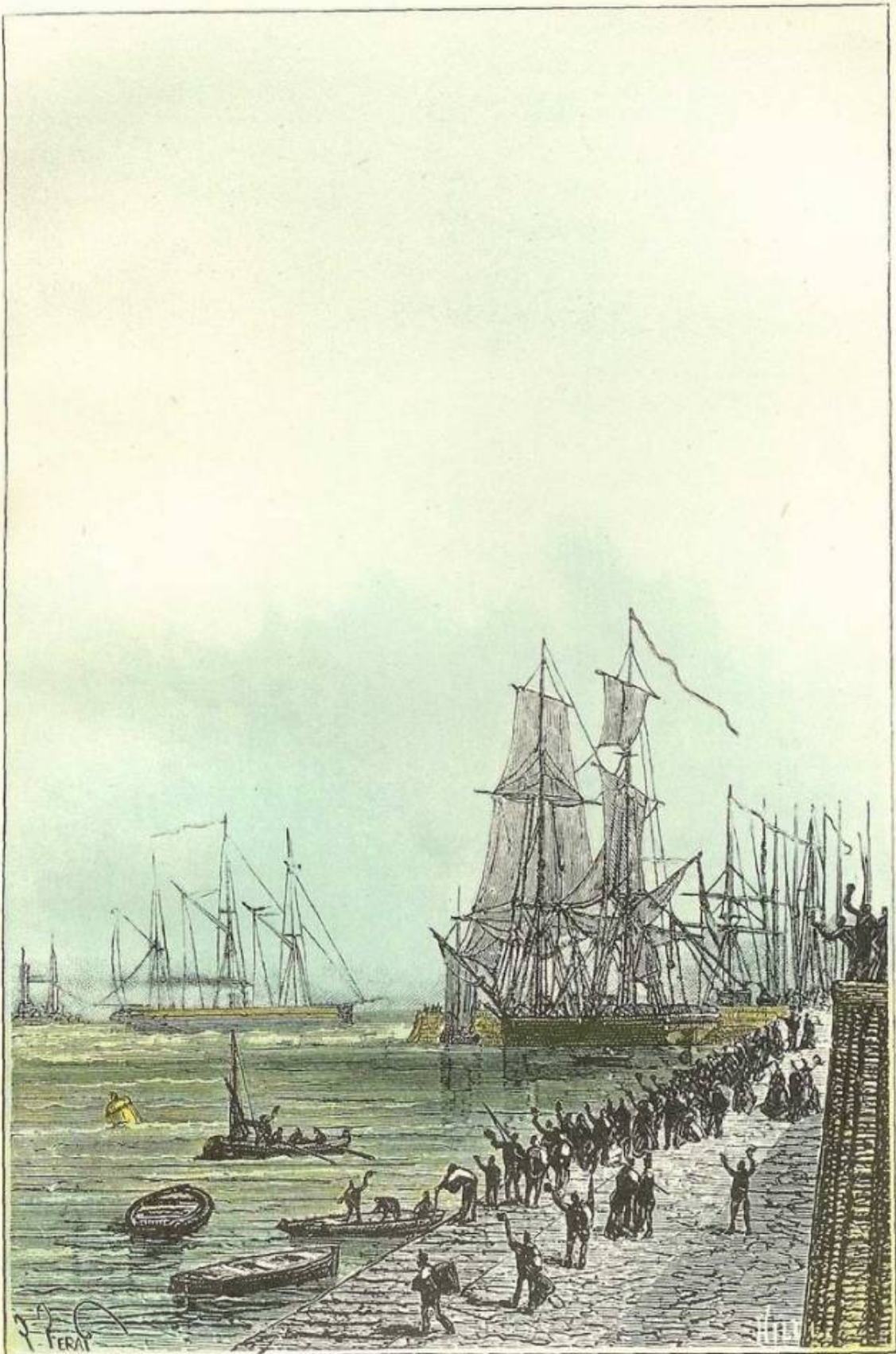
« LE DELPHIN » S'ÉBRANLA, PASSA ENTRE LES NAVIRES DU PORT. (Page 126.)