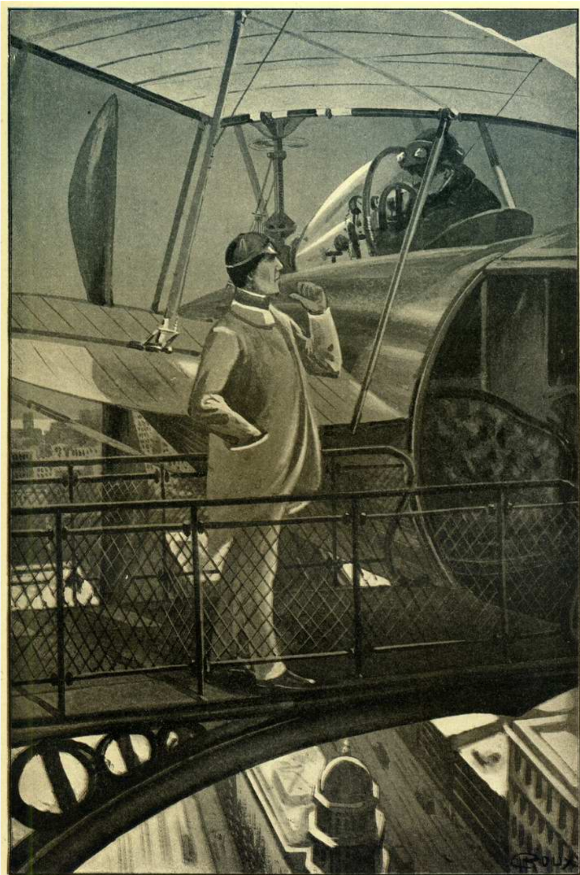
« OU VA MONSIEUR ? » DEMANDA L'AÉRO-COACHMAN. (Page 193.)